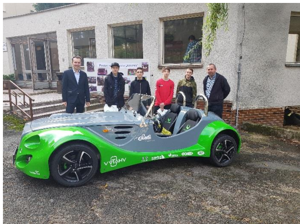
Předávání sponzorských darů

Zřizovatel: Kraj Vysočina Název ŠVP: Opravář zemědělských strojů Délka a forma vzdělávání: tříleté denní Platnost ŠVP: od 1. 9. 2022 počínaje 1. ročníkem