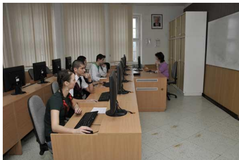
Učebna výpočetní techniky 2