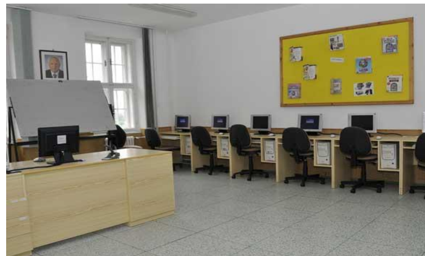
Učebna výpočetní techniky 3