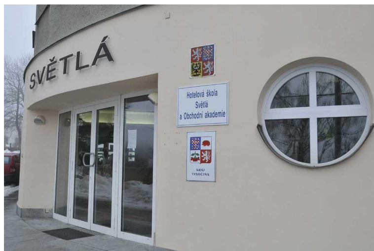
Hlavní vchod do budovy školy