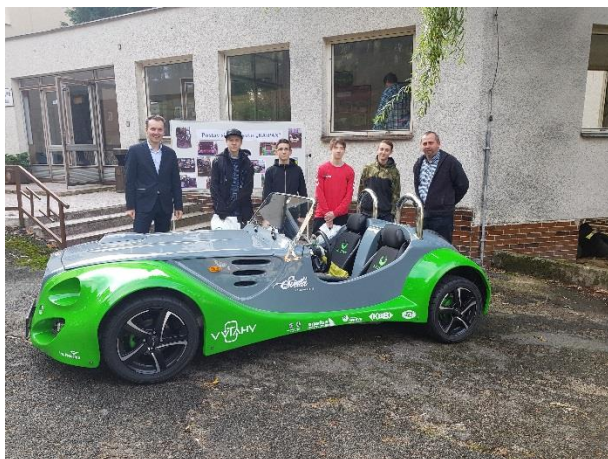
Předávání sponzorských darů