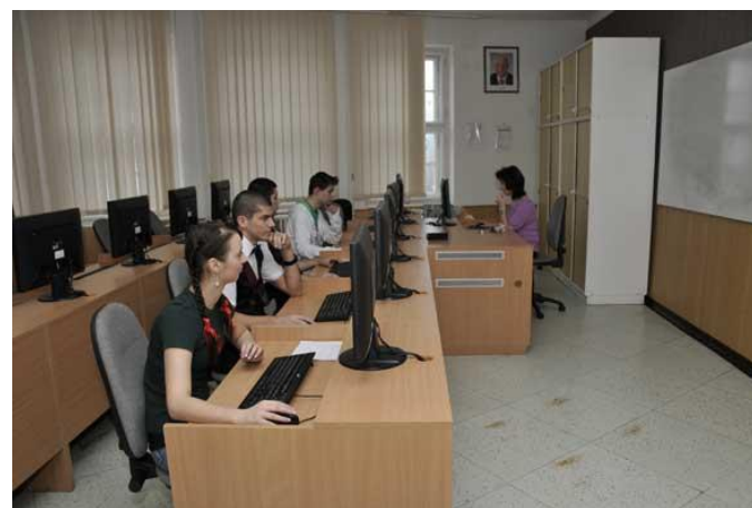
Učebna výpočetní techniky 2